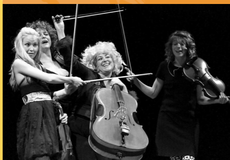
QUARTETTO EUPHORIA Breno, 12 agosto