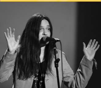
MOMO Bienna, 18 settembre