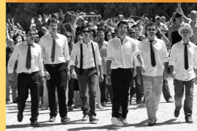
CORDEPAZZE Brescia, 9 ottobre