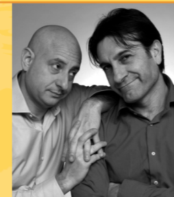
BOUE e LIMARDI Esine, 4 settembre