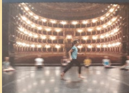
La passione teatrale